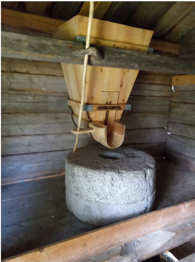
Kvarnstenarna och spannmålens matningsmekanism i en kvarn vid Torvsjö kvarnar.