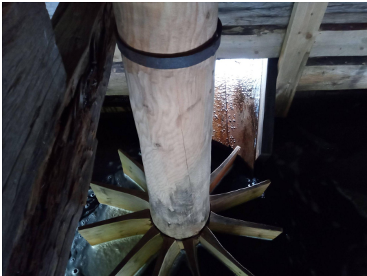
Skovelhjulet i en kvarn vid Torvsjö kvarnar. Foto: Mats Pleje 2024.