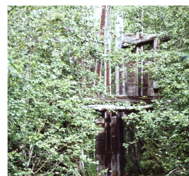
Smånäsdammet. Foto: Gösta Pleje 1971.

Dammar byggdes för att magasinera vattnet för fortsatt transport av timret. Smånäsdammet ca 1300 m nedströms Sågplatsen, är ett exempel på detta.