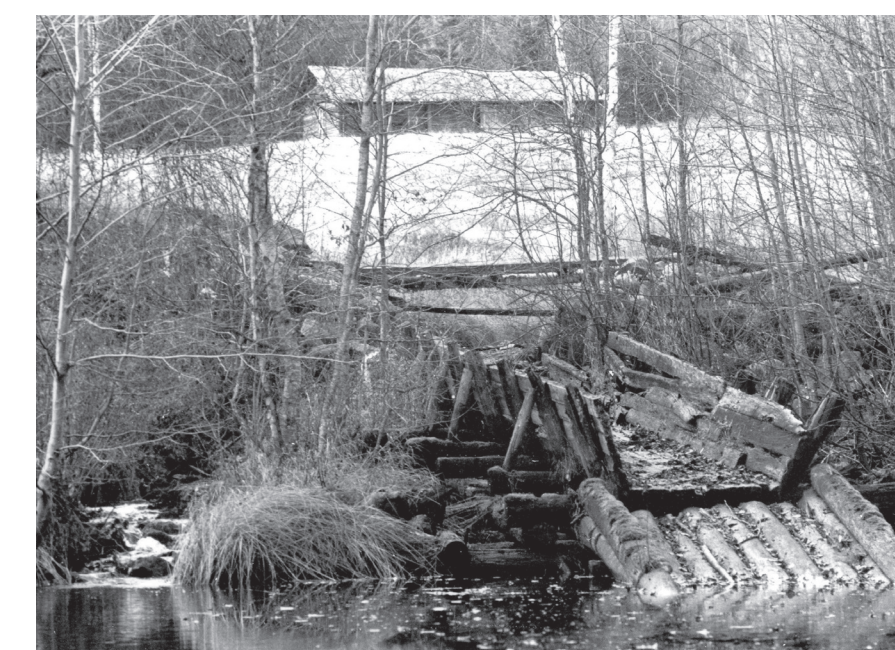
Flottningsrännan här vid Kvarnforsen 1974.