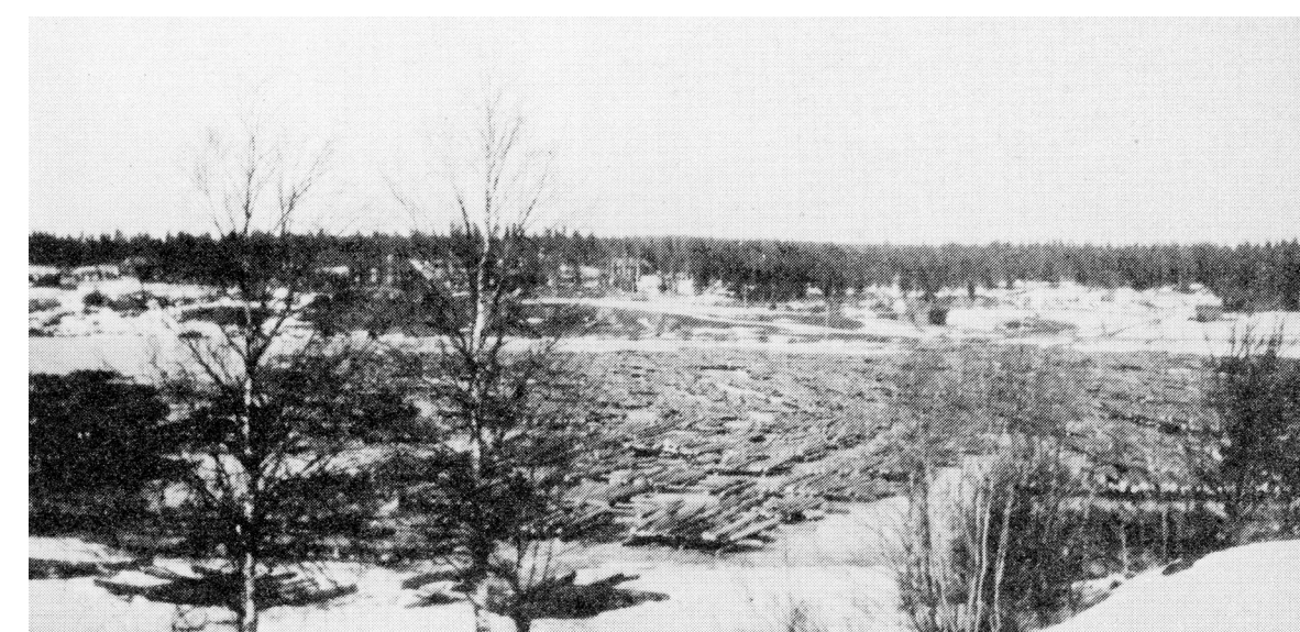
Flottningstimmer på isen vid Bastuträskets södra ände, april 1948.

Bastuträskbäcken rensades från block och stenar samt rätades ut. Flottningsrännor byggdes här vid Kvarnforsen och vid Sågforsen.