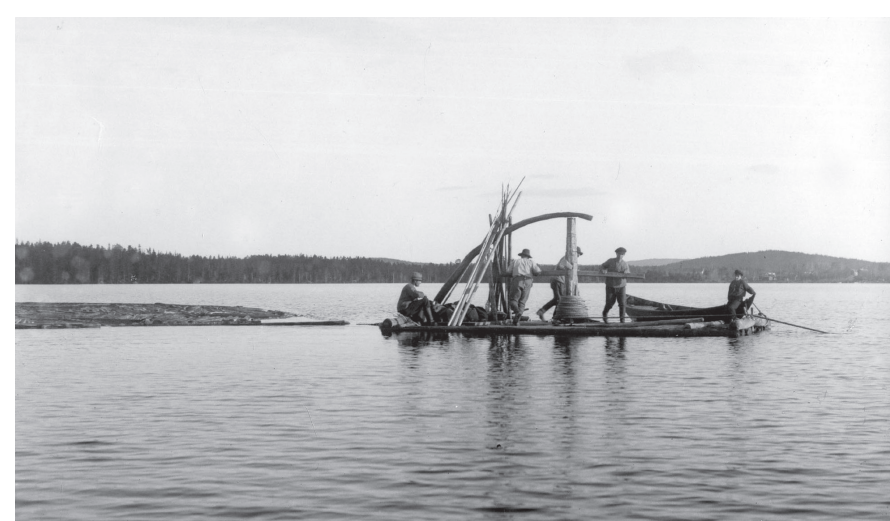
Spelflotte Flodasjön Dalarna

Det timmer som kom från Västansjöskogen via Vinmyrbäcken och Bäckmyrbäcken flottades över sjön med hjälp av en spelflotte, med timret samlat i en sk. ringbom.