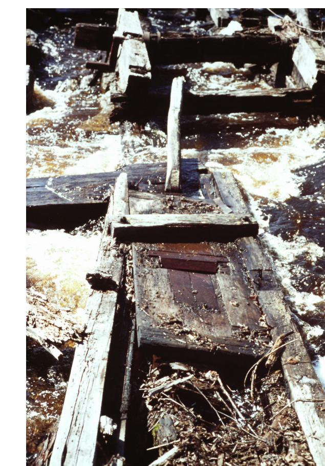
Spånhyveln 1971