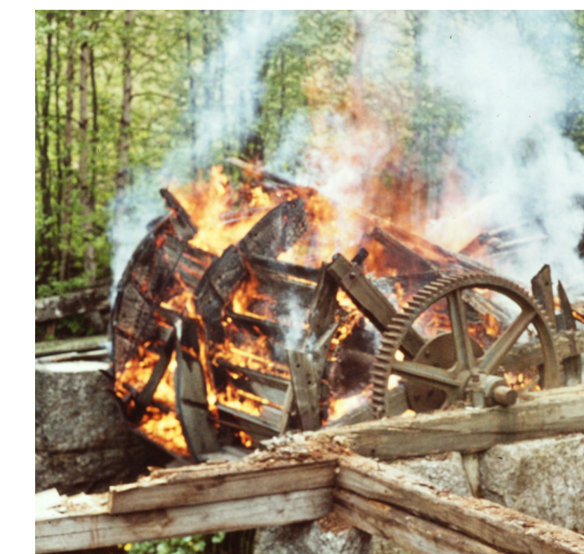
Vattenhjulet eldades upp 1971