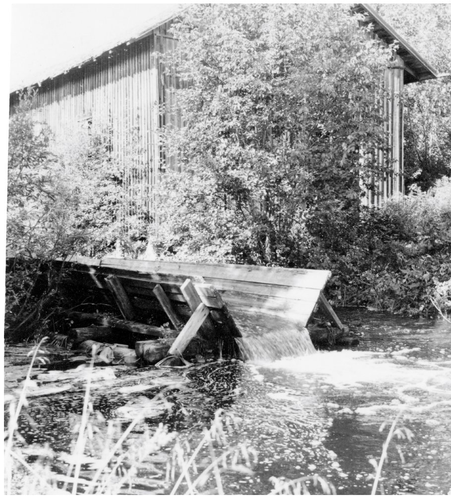
Såghuset med flottningsränna tidigt 50-tal