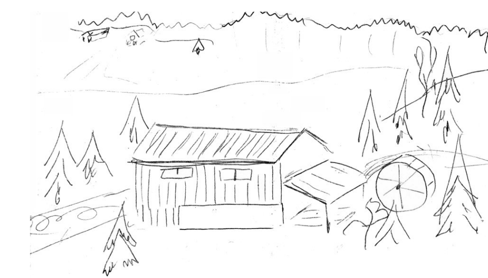
Bild: Anna-Lisa Pleje på kallelse till "Möte om försäljning av sågen" 1961

På bilden kan du se såghuset, med spånhyvelhuset vid såghusets gavel och det rektangulära hålet, där de stockar som skulle sågas rullades in. Vattenhjulet låg i höjd med såghusets nordvästra gavel. Grundstenarna till cirkelsåghuset och fundamentet till vattenhjulet är fortfarande i stort sett intakta.