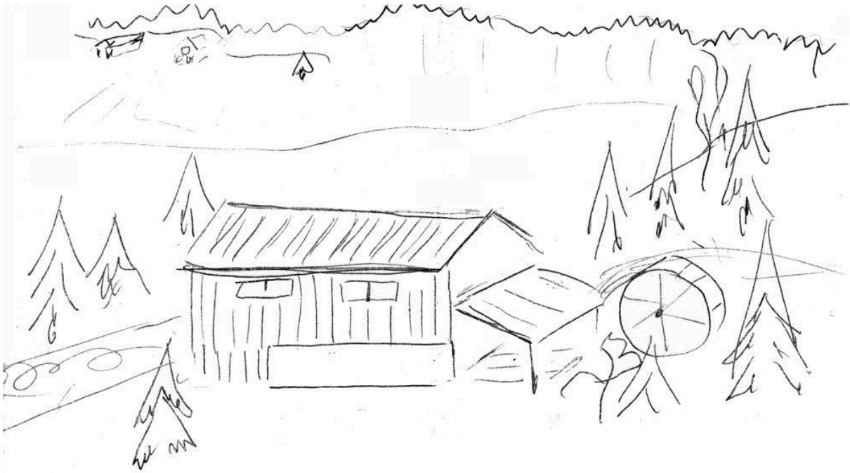
Bild: Anna-Lisa Pleje på kallelse till "Möte om försäljning av sågen" 1961

På bilden kan du se såghuset, med spånhyvelhuset vid såghusets gavel och det rektangulära hålet, där de stockar som skulle sågas rullades in. Vattenhjulet låg i höjd med såghusets nordvästra gavel.