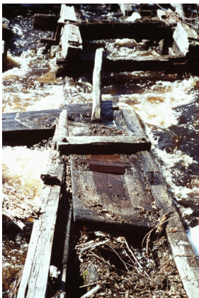
Spånhyveln 1971

Förutom cirkelsågen fanns här också en spånhyvel vid såghusets norra gavel, där takspån för taktäckning hyvlades/revs.