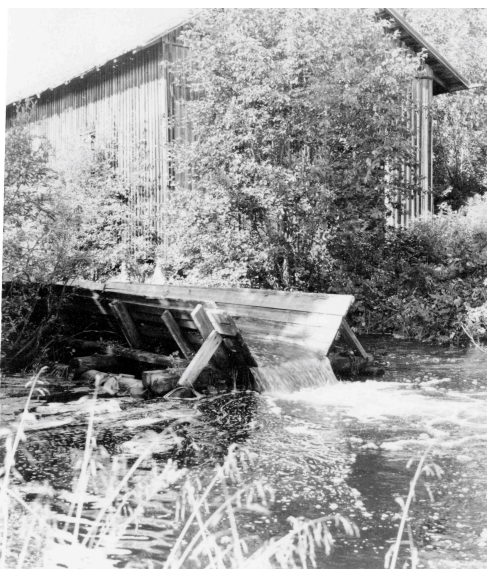
Såghuset med flottningsränna tidigt 50-tal.

På denna plats fanns tidigare kvarn, ramsåg, cirkelsåg, takspånshyvel och en 50 m lång flottningsränna.